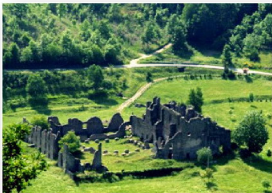
Ruderi dell'Abbazia di Santa Maria di Corazzo (XI secolo)